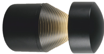
Torch Rounded-W 15W IP65