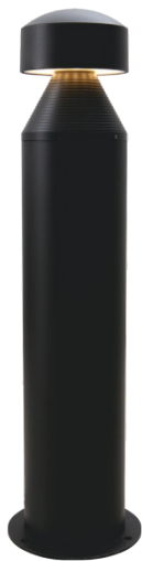
Torch Rounded-G 25W IP65