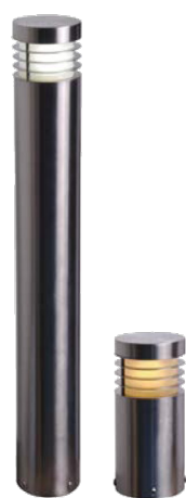
Holler Slim IP65