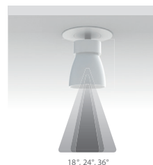
18°, 24°, 36°